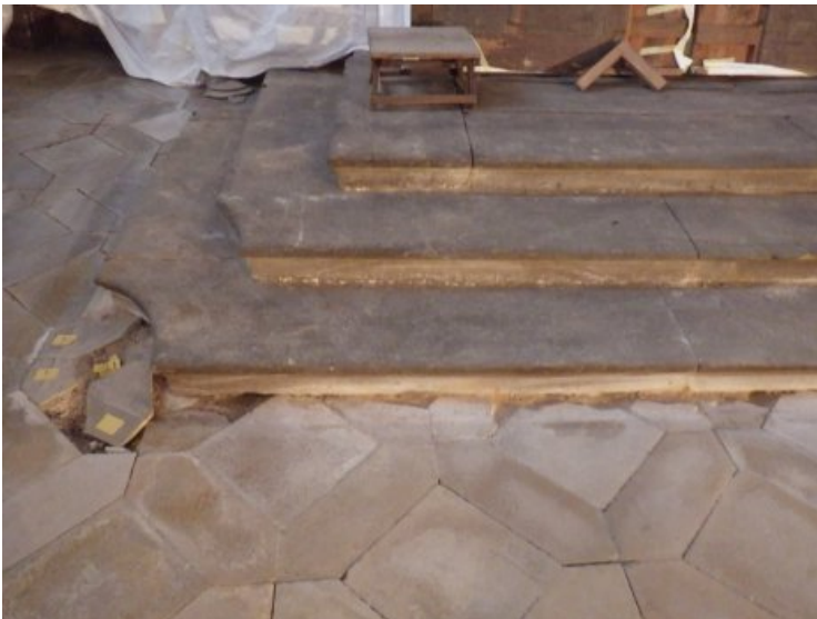
Gebrochene Bodenplatten wurden aufgenommen.