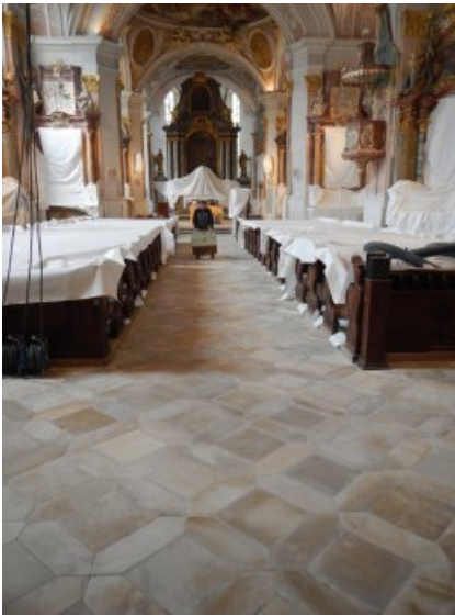
Der Blick in den Kirchenraum nach dem Verfügen. Anschließend wurde der Boden abgedeckt, ein Innengerüst gebaut und die Raumschale restauriert.