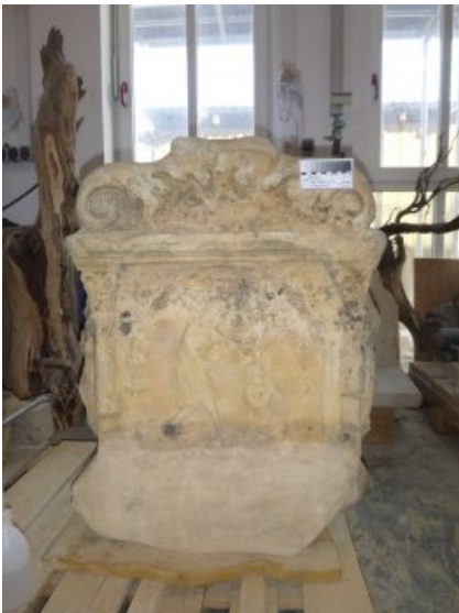
Zwischenzustand: Der ergänzte Bereich nach Überarbeitung der Steinersatzmasse und farbliche Anpassung an Bestand.