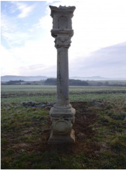
Endzustand nach Ergänzung und Fundamentierung