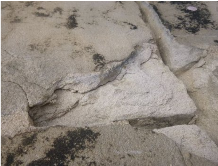
Zwischenzustand nach der Abnahme einer defekten Fuge: die darunter befindliche Zone ist stark entfestigt, absandend und abblättern.