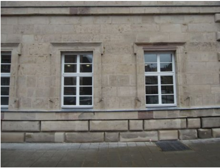
Fassadenabschnitt des Erdgeschosses nach Beendigung geplanter Arbeiten mit nahezu vollständiger Reduzierung der schwarzen Krusten.