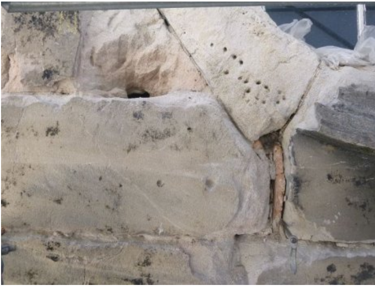
Weiteres Detailfoto der schadhaften Steinoberfläche mit Insektenlöchern innerhalb der mürben Struktur.