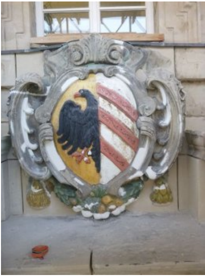
Zwischenzustand des Westportal-Wappens mit ergänzten Fehlstellen.