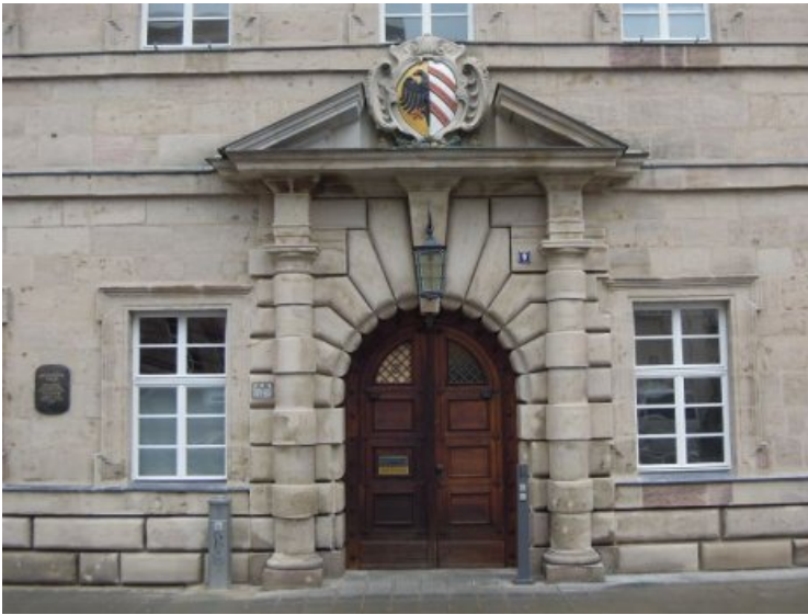
Gesamtaufnahme des Westportals nach Fertigstellung aller Maßnahmen.