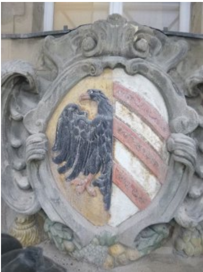
Das Wappen des Westportals zu Beginn der restauratorischen Maßnahmen: das Erscheinungsbild wirkt wenig repräsentativ, die Farbfassung ist teilweise beschädigt und/oder verlorengegangen.