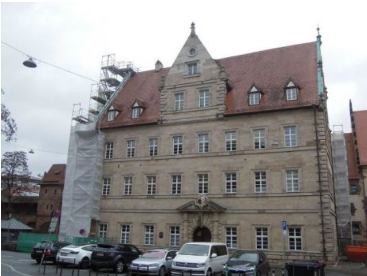
Erscheinungsbild der Westfassade nach Abschluss aller Maßnahmen, die deutlich homogener als im Vorzustand wirkt.