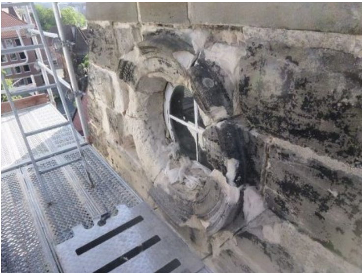
Rundfenster (Oculus) an der Westfassade vor dem anstehenden Natursteinaustausch aufgrund tiefreichender Schädigung.