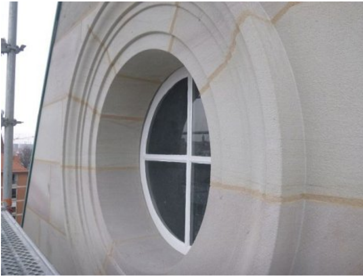
Rundfenster (Westfassade) nach Abschluss der Arbeiten.