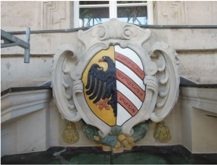
Westportal-Wappen nach Abschluss aller Maßnahmen.