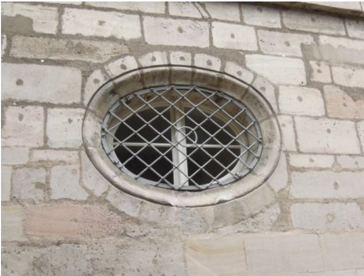
Detailfoto eines Rundfensters mit umgebenden Fugen und Ergänzungen einer früheren Restaurierung, die durch oberflächlich auflagernde Verschmutzungen visuell dunkler erscheinen.