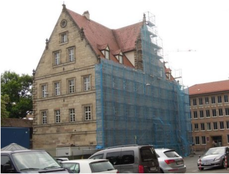
Das Baumeisterhaus vor der Restaurierung mit bereits eingerüstetem Fassadenabschnitt. Die Südseite des Gebäudes zeigt deutlich das schadhafte Natursteinensemble.