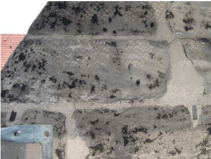
Detailfoto der Steinoberfläche, die nicht nur in vorhandenen Vertiefungen intensive Verschwärzungen aufweist, sondern auch zahlreiche Risse sowie schadhafte Ergänzungs- und Fugenmörtel.