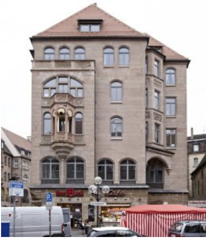
Die Fassade des Wohn- und Geschäftshauses in der Königstraße 70 in Nürnberg nach der Restaurierung, noch vor Einbau der neuen Erkerbrüstung und Bearbeitung des EG.