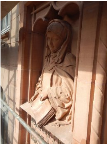
Das Relief der Caritas Pirkheimer nach der Konservierung und Restaurierung.