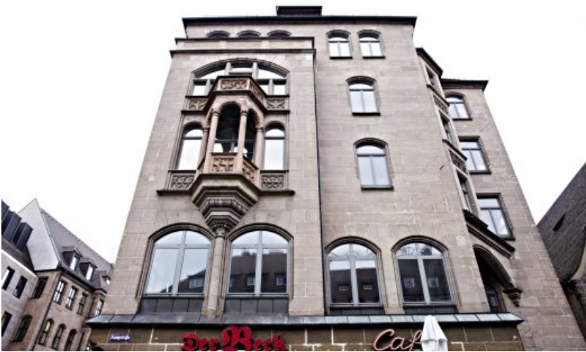
Die Fassade des Wohn- und Geschäftshauses in der Königstraße 70 in Nürnberg vor der Restaurierung.