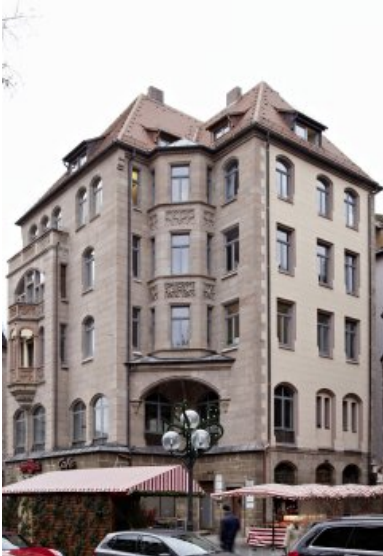
Die Fassade des Wohn- und Geschäftshauses in der Königstraße 70 in Nürnberg nach der Restaurierung, noch vor Einbau der neuen Erkerbrüstung und Bearbeitung des EG.