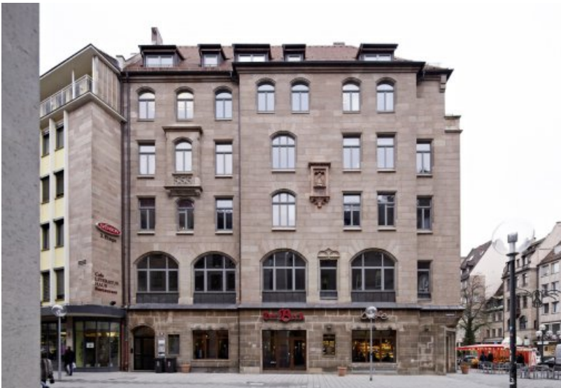
Die Fassade des Wohn- und Geschäftshauses in der Königstraße 70 in Nürnberg nach der Restaurierung, noch vor Einbau der neuen Erkerbrüstung und Bearbeitung des EG.