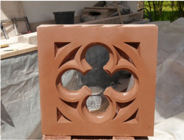
Das Neuteil der Erkerbrüstung bei der Herstellung.