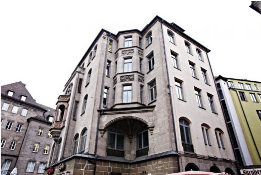
Die Fassade des Wohn- und Geschäftshauses in der Königstraße 70 in Nürnberg vor der Restaurierung.