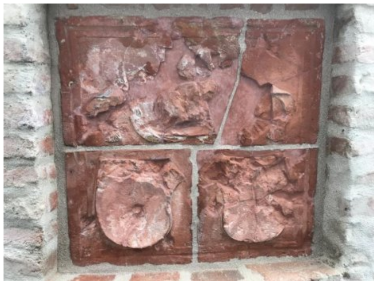
Ansicht des restaurierten und neu verfugten Terrakotta-Wappens.