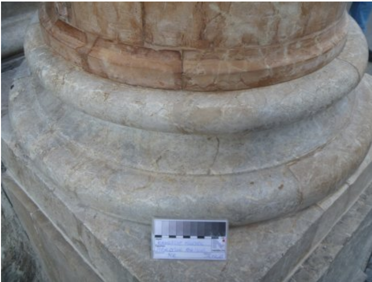
Detail der Säulenbasis mit ausgetauschter, in Farbigkeit und Eigenschaften an den Kalkstein angepasster Ergänzungsmasse und Schlämme zum Verschluss der Flankenabrissse des Fugenmörtels.