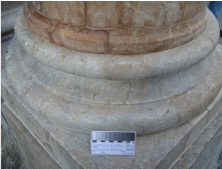
Detail der Säulenbasis mit ausgetauschter, in Farbigkeit und Eigenschaften an den Kalkstein angepasster Ergänzungsmasse und Schlämme zum Verschluss der Flankenabrissse des Fugenmörtels.