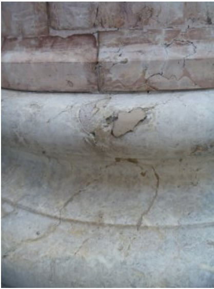
Detail der Säulenbasis mit defekter Altergänzung und defektem, aber stabil liegendem Fugenmörtel.