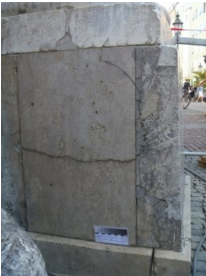
Das Postament weist defekte Altergänzungen, Abbrüche sowie desolate Fugen und offene Risse auf.