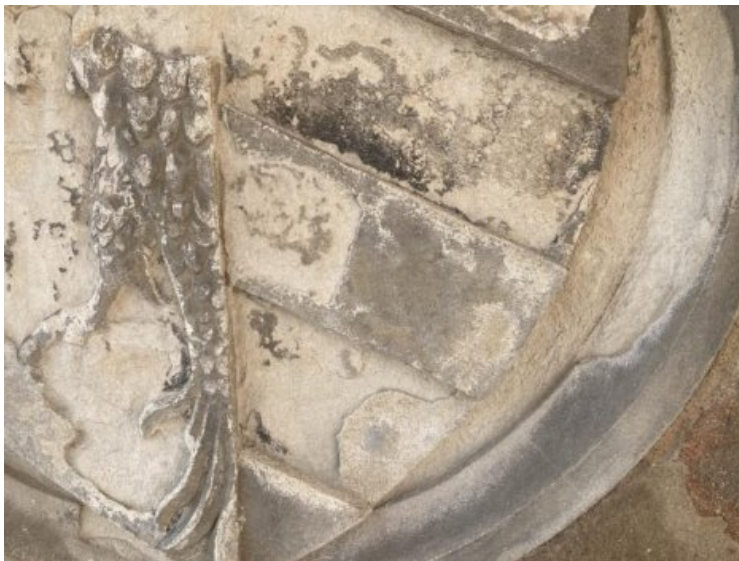
Stark reduzierte Oberflächen, Gipskrusten und Salze belasten das Objekt