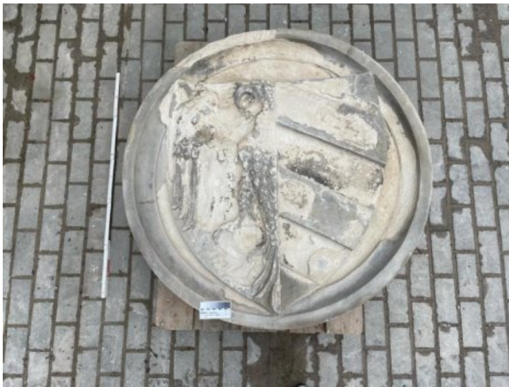
Das Originalwappen ist in einem äußerst schlechten Zustand