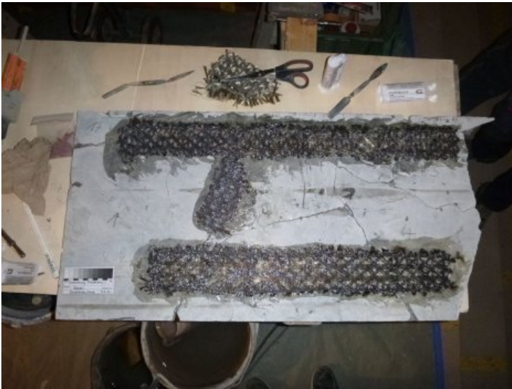
Die Rissbehandlung wurde zusätzlich mit Basaltgewebe verstärkt.