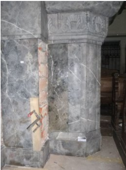
Rückversetzung der Platten am Kanzelfuß.