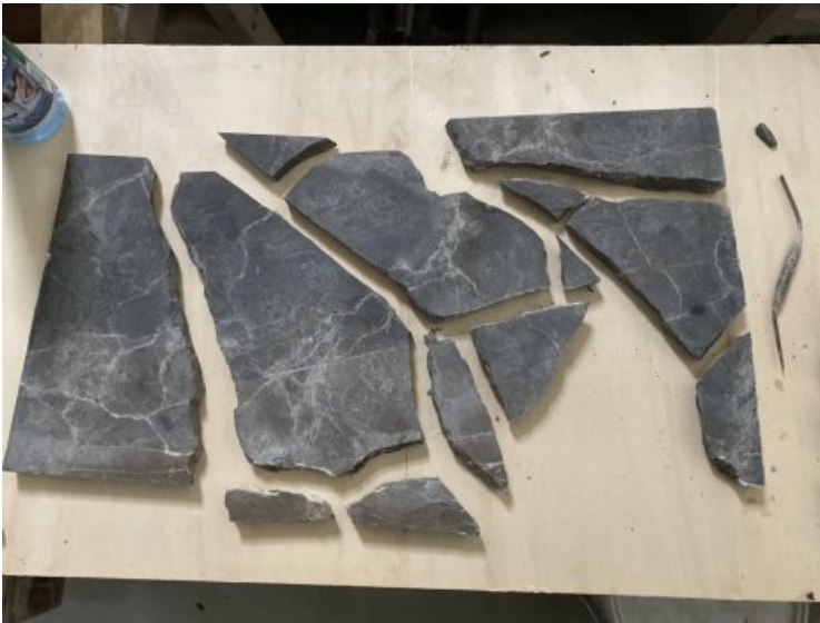
Gebrochene Platte der Kanzel.