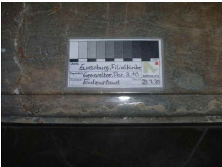
Nachzustand: Geschlossener Riss.