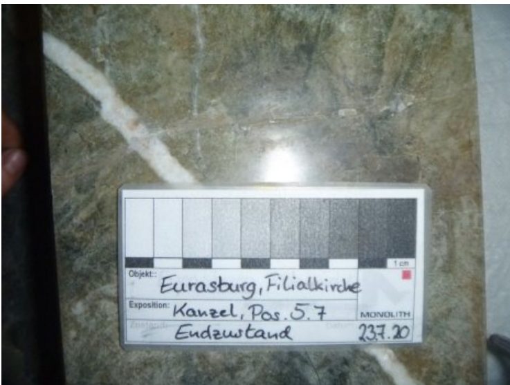
Der Riss wurde oberflächlich verschlossen.