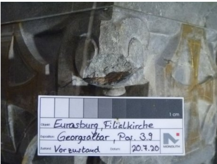
Fehlstelle am Georgsaltar.