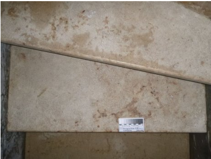
Nachzustand der Platten im Kanzelaufgang.