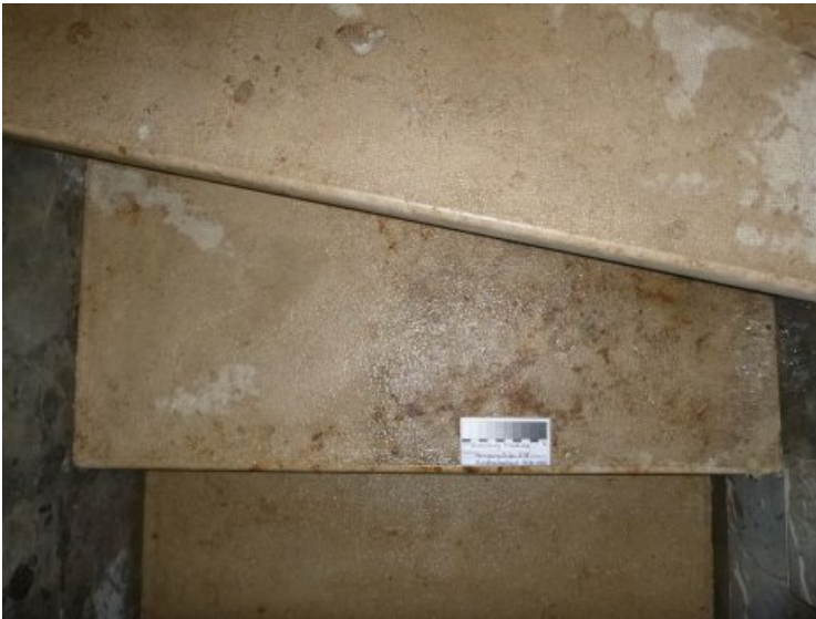
Schadhafte Platten wurden ausgebaut, gereinigt, restauriert und rückversetzt.