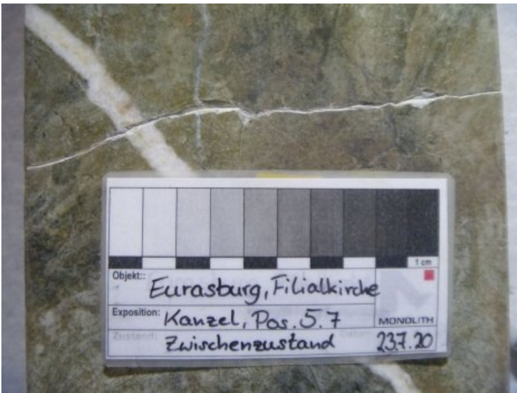
Arbeitsfoto: Geklebter Bruch an der Kanzelplatte auf dem Holzträger