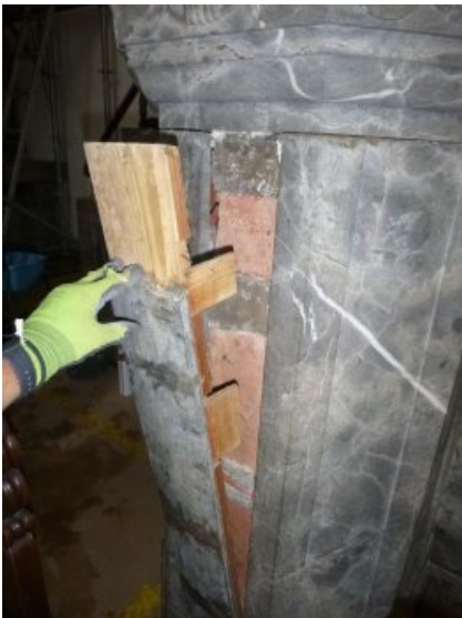
Während des Ausbaus der defekten Platte.