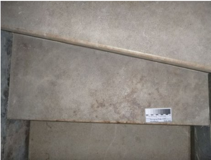
Treppenaufgang zur Kanzel im Vorzustand.