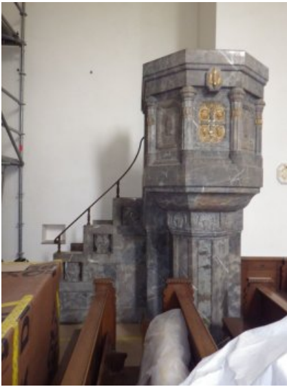
Die Kanzel im Vorzustand.