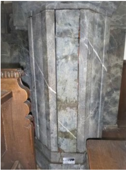
Defekte Abdeckplatte an der Kanzel mit weit geöffneten Fugen.