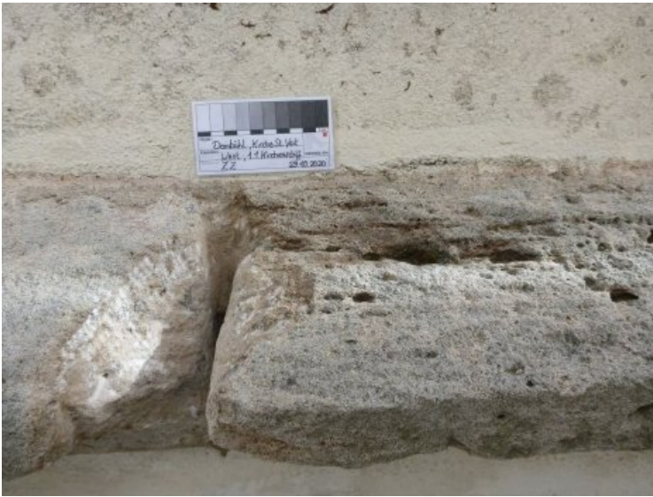
Die defekte Altergänzung wurde entfernt.