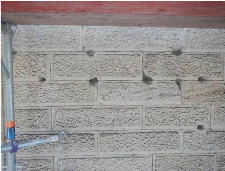
Entstandene Fehlstellen nach dem Ausarbeiten alter Verankerungen.