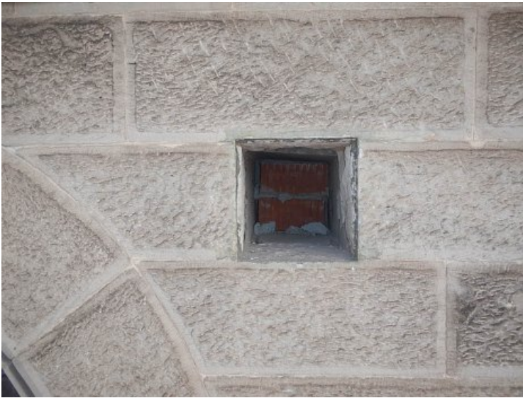
Vorzustand: Aus Naturstein zu ergänzende Fehlstelle.