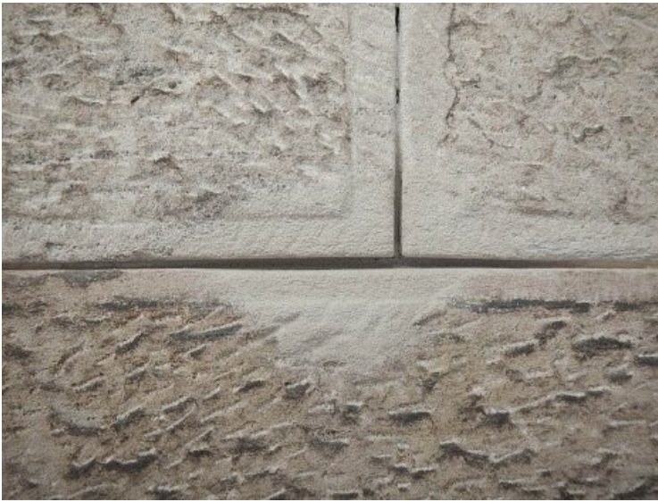
Detailansicht einer Fehlstellenergänzung.