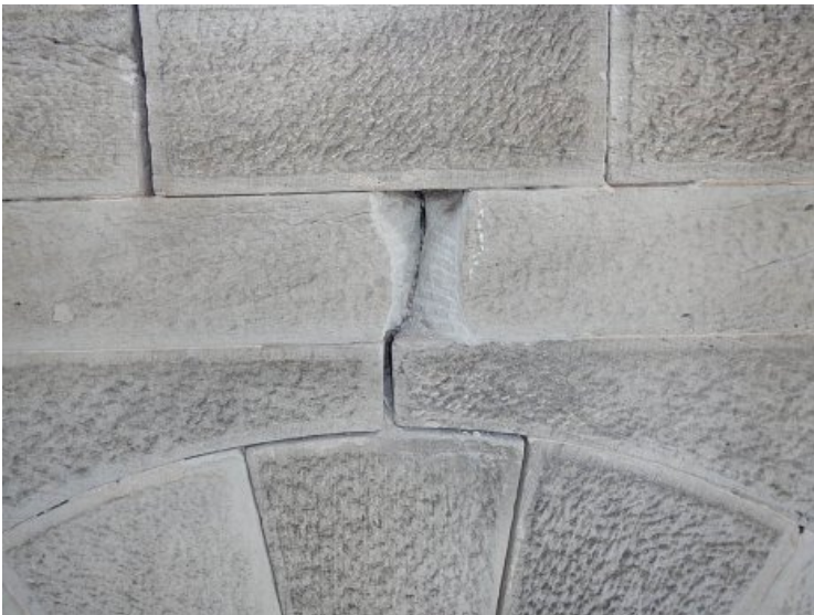
Vorzustand: Fehlstelle am Sandstein und tiefe Fugen.