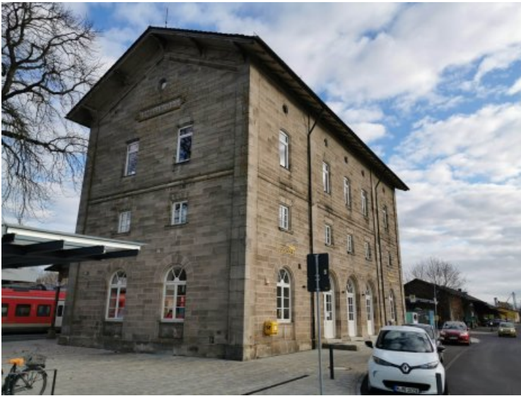
Das Gebäude im Vorzustand, auf der Westfassade liegen Algen auf, es sind Verschmutzungen durch Vogelkot vorhanden, der Schriftzug ist fast nicht wahrzunehmen.