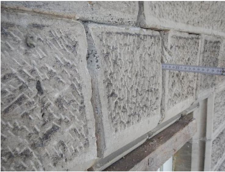
Vorzustand: Offenes Fugennetz um das Fenstergewände, etwa 27 cm tiefer Hohlraum.