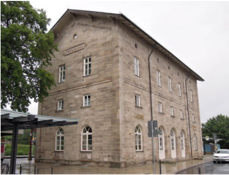
Das Bahnhofsgebäude in Süd-Westansicht nach Abschluss der Arbeiten.