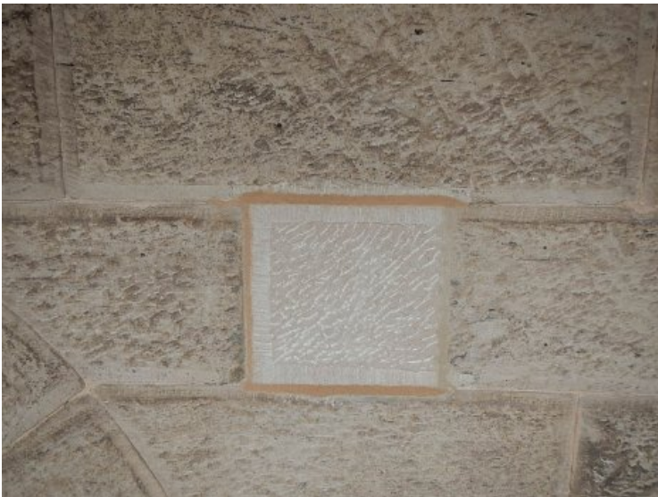
Nachzustand: Eingesetzte Vierung