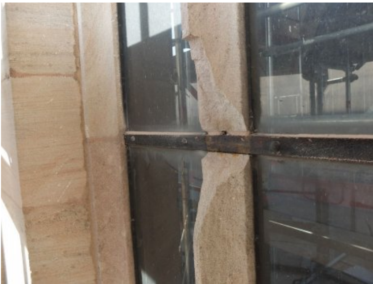
Die bruchhaften Stücke wurden abgenommen.