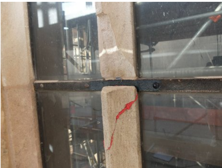
Arbeitsfoto: Verklebung mit Epoxidharz und Replatzierung.