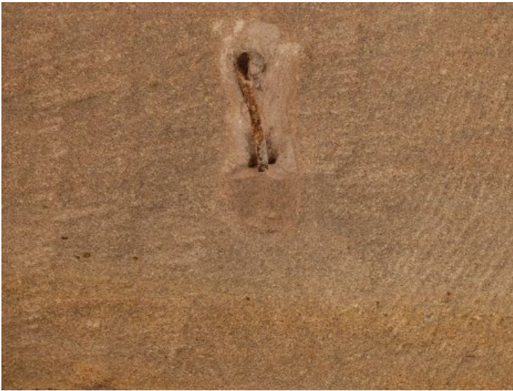
Teilweise befanden sich Fremdkörper in der Wand, wie hier ein rostendes Metallteil, die es auszubauen galt.