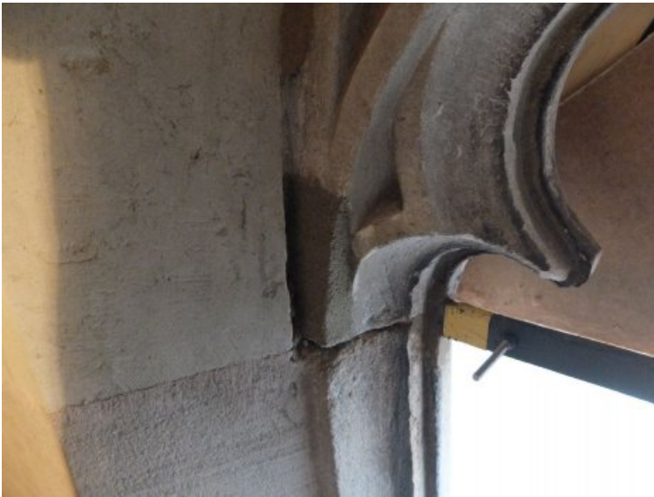
Ergänzung an der Fensterlaibung an der Innenseite.