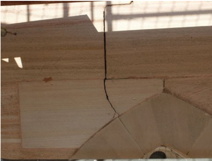
Vorzustand: Riss im Werkstein.