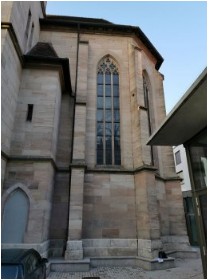
Der Ostchor der Herz-Jesu-Kirche.