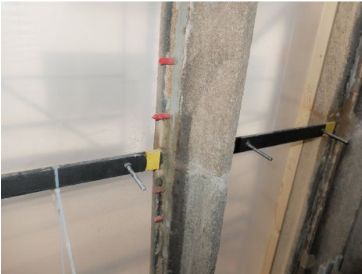
Rissverschluss am Fenster.