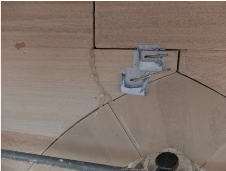
Arbeitsfoto: Für die Vernadelungen wurden Bohrungen senkrecht zum Riss gesetzt und Gewindestäbe eingesetzt.