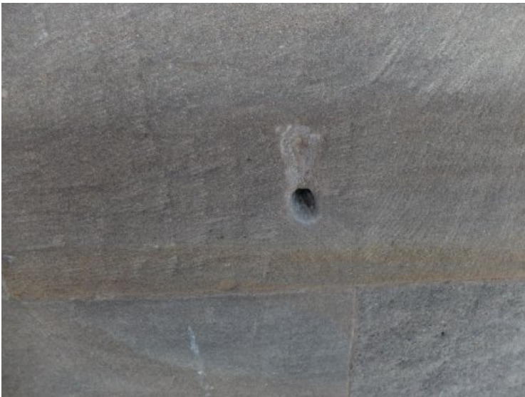
Die entstandenen Fehlstellen wurden geschlossen.