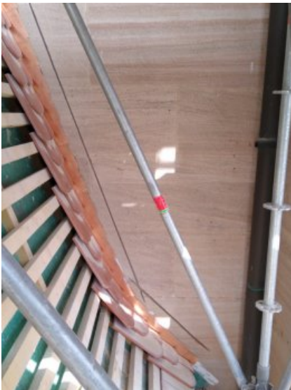
Zur Anbringung der Verblechung wurde parallel zur Dachoberfläche eine Nut gefräst.