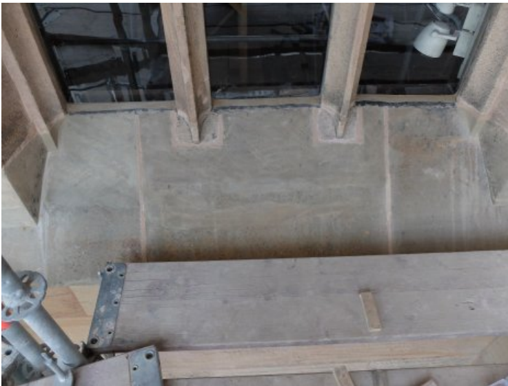
Nachzustand: Die farblich unpassende Erganzung wurde retuschiert.