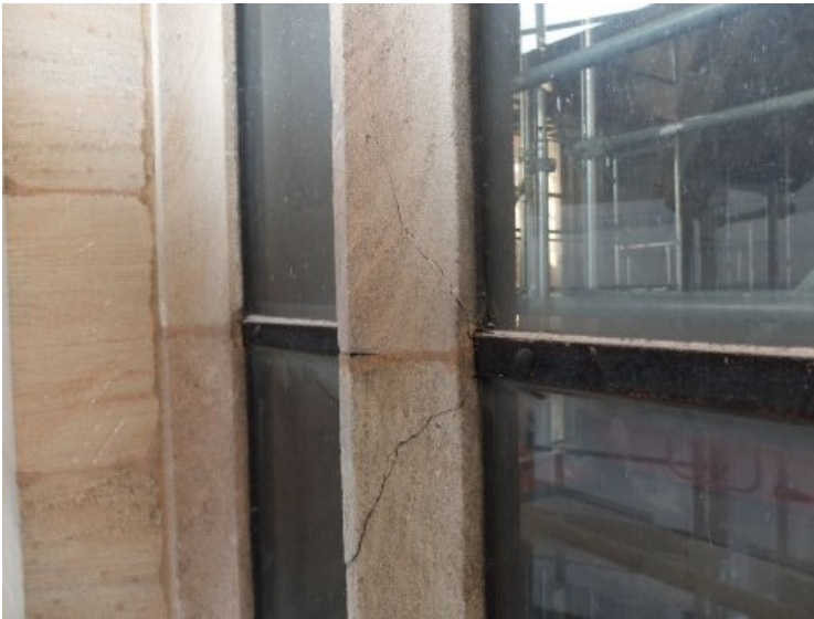
Vorzustand: Bruchhafte Stelle am Fenster.