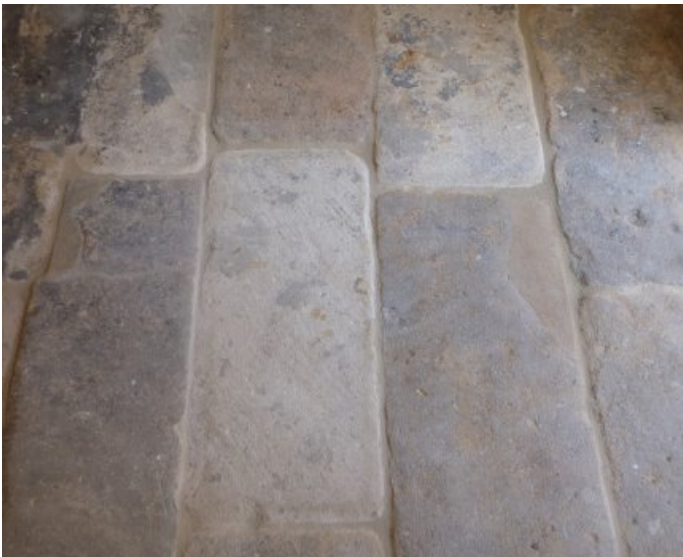
Der Bodenbelag im Eingangsbereich nach der Restaurierung.