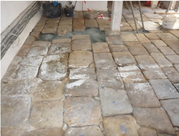
Bodenbelag in der Remise während der Restaurierung.