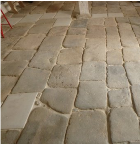
Bodenbelag in der Remise nach der Restaurierung.