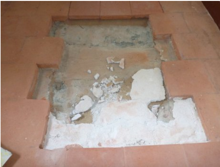
Beim Aufheben der Bodenplatten aus Terrakotta im Flur zeigte sich, dass sich darunter loser Mörtel, Sand und Holzbalken befinden.