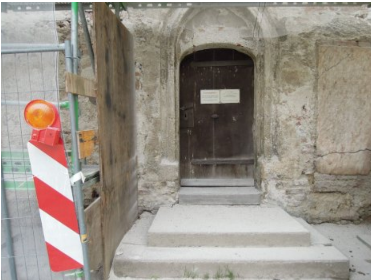
Schadbild und Bausituation des Portals im Vorzustand.