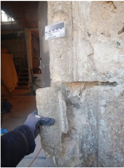
Stark entfestigter Stein und Bruchstück.