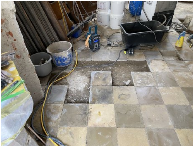
Die Bodenplatten unter der Empore während des Austauschs.