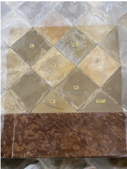
Gereinigte Fläche an der Stufe, mit Markierungen für die Bearbeitung der angrenzenden Bodenplatten.