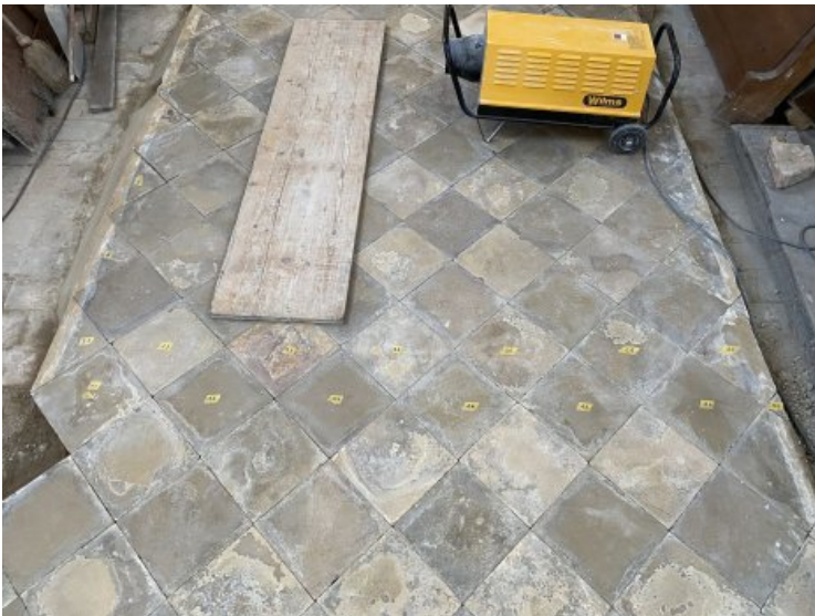
Die markierten Platten wurden für das Öffnen des Bodens herausgenommen.