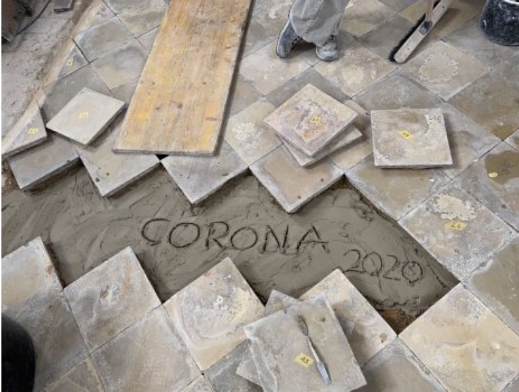
Arbeitsfoto: Während dem Versatz der Bodenplatten.