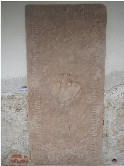
Die restaurierte Grabplatte mit gereinigter und geschlossener Steinoberfläche.