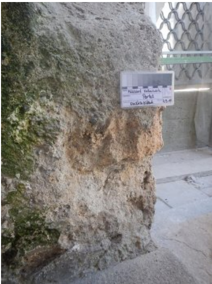
Fehlstelle am Sockel des Portals.