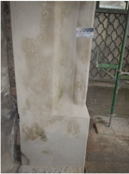
Nachzustand, Anstrich erfolgt bauseits.