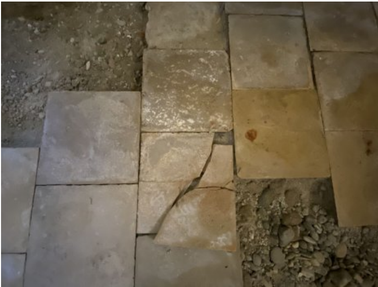
Detailaufnahme der gebrochenen Bodenplatte der Sakristei.