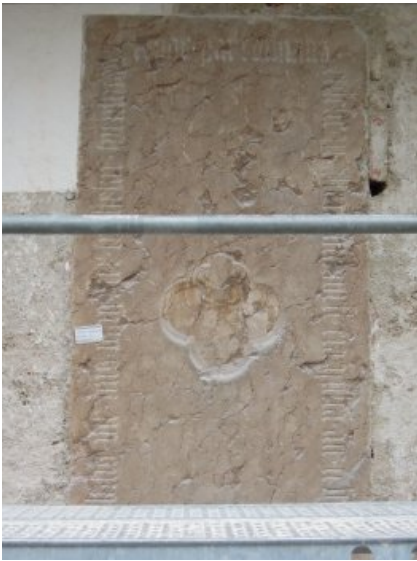
Epitaph im Vorzustand, verschmutzt und schadhafte.