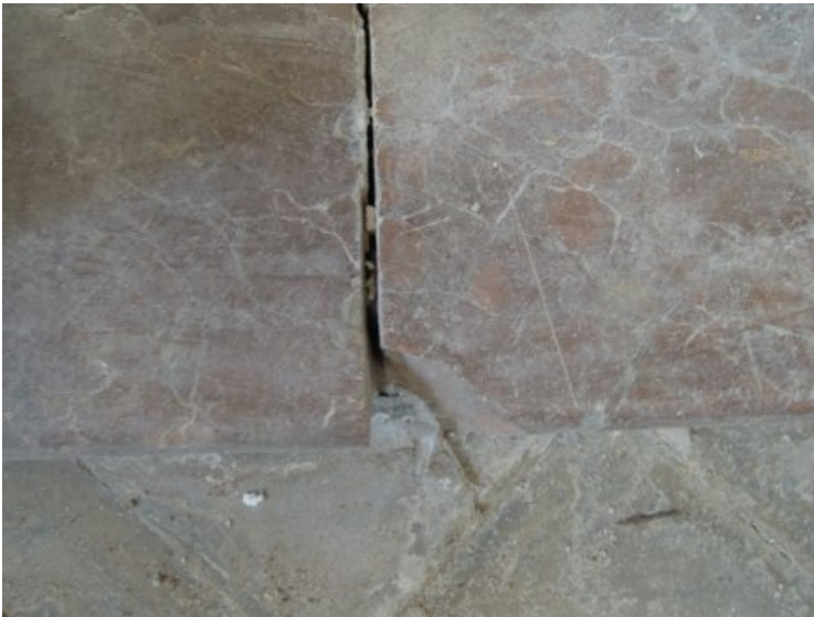
Detail: Fehlstelle im Rotmarmor der Antrittsstufe zum Chor.