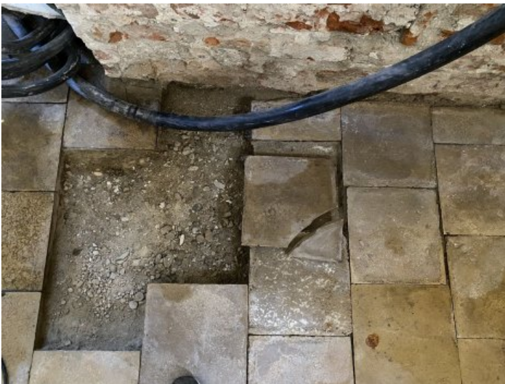
Boden Sakristei: Stark geschädigter Bereich mit bereits entnommenen Platten.