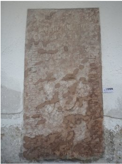
Während des Fehlstellenverschlusses: Frisch angetragene, noch feuchte Kittmasse.