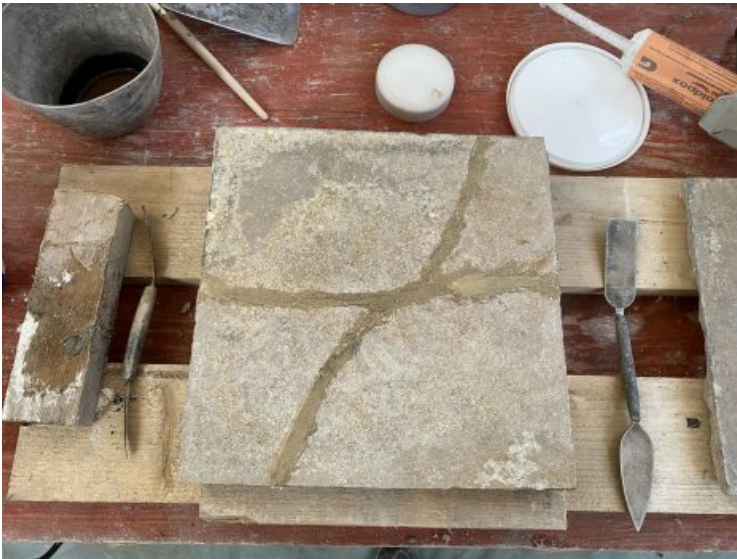
Während der Rissbearbeitung.