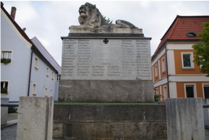
Das Denkmal vor der Maßnahme