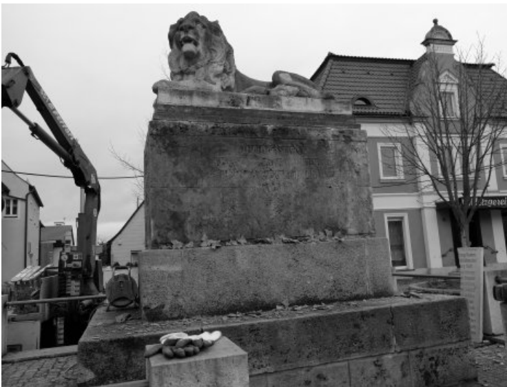
Beim Abbau der Schriftplatten - diese wurden in der Werkstatt restauriert