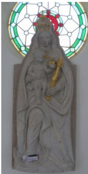
Nach Konservierung und Restaurierung der Marienskulptur.