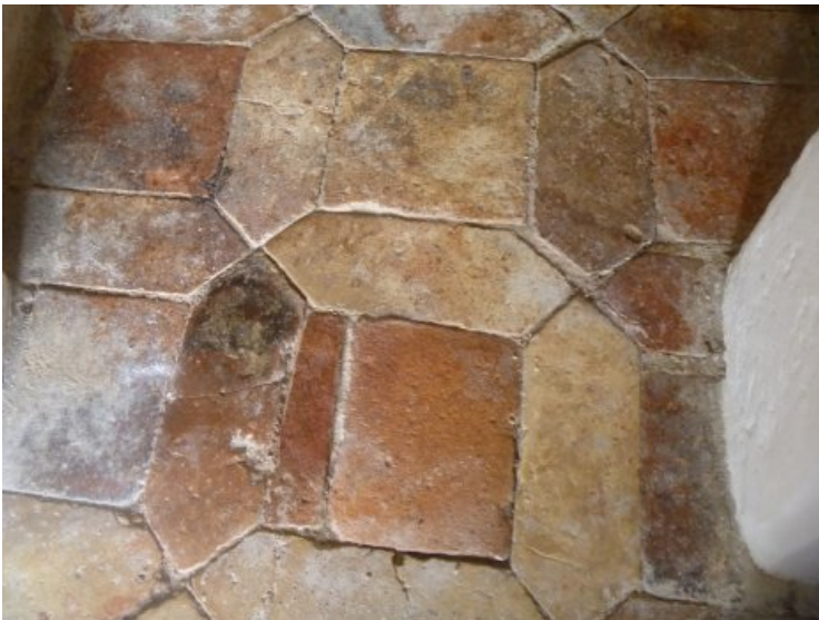
Nach der Restaurierung des Bodens im Turm.