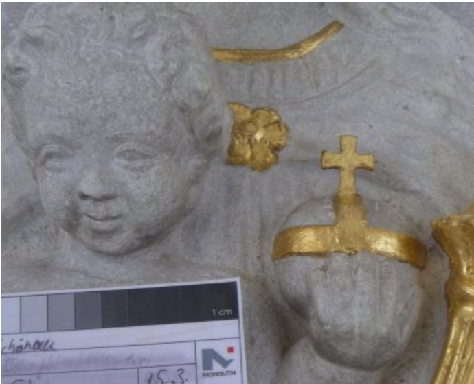
Die Vergoldung an den Attributen, Säumen und der Schließe wurde erneuert.