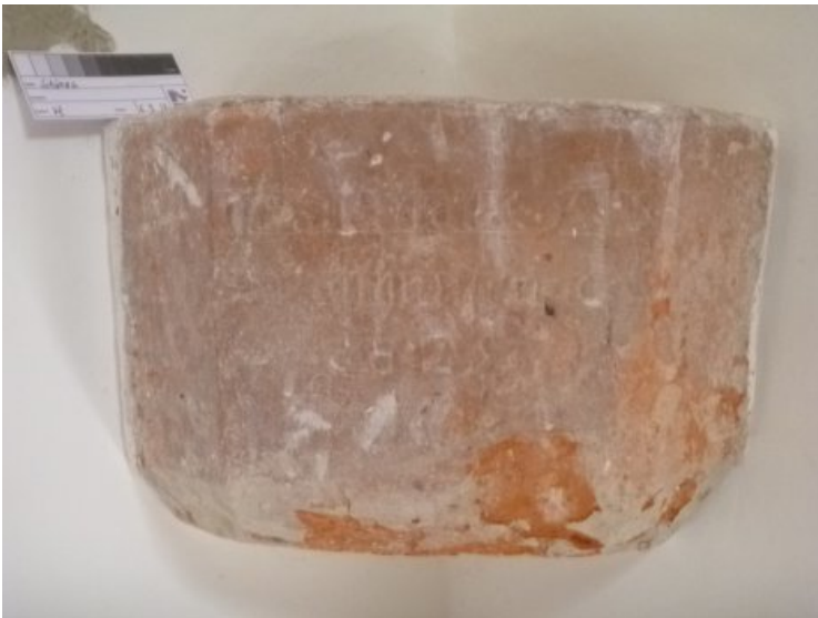
Das Weihwasserbecken vor der Restaurierung und Konservierung.