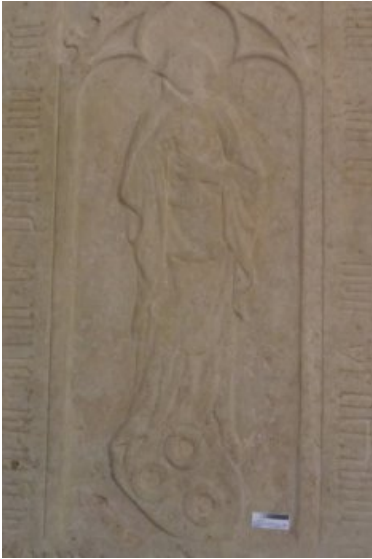
Das Epitaph des Pfarrers Seyfried Hegner nach der Restaurierung und Konservierung.