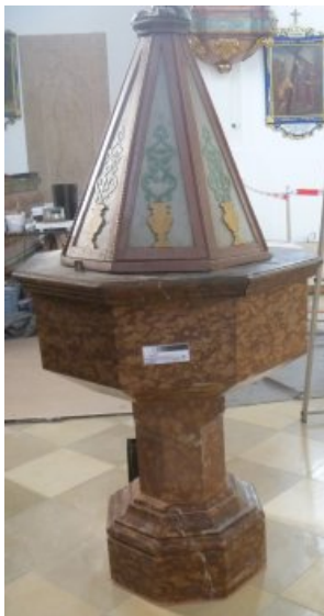
Der Taufstein nach der Restaurierung und Konservierung am neuen Aufstellungsort.