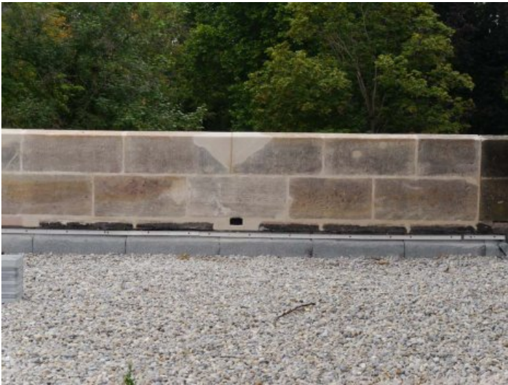
Detail zur Ergänzung und Neuverfugung der Mauerkrone im Endzustand.