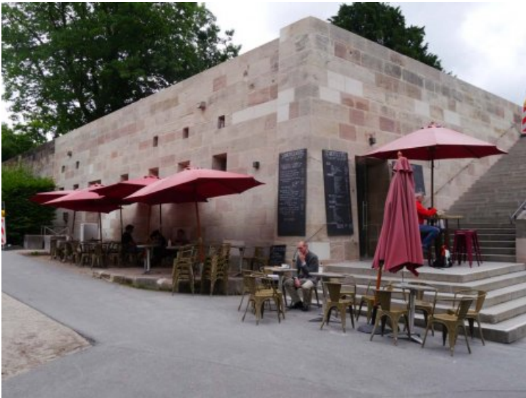
Café Schnepperschütz nach der Restaurierung.