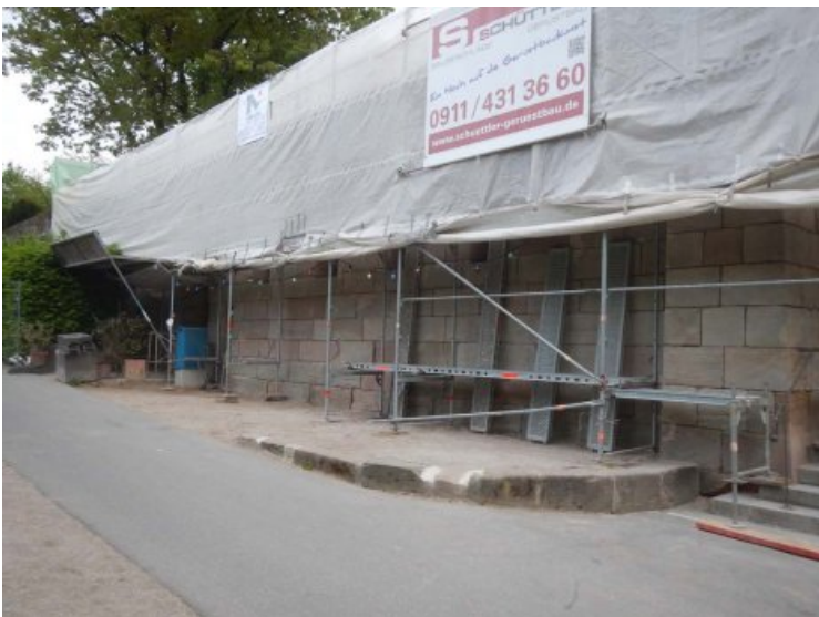
während der Restaurierung.