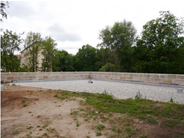
Wieder ertüchtigtes Bodenniveau rückseitig mit restaurierter Mauerkrone.