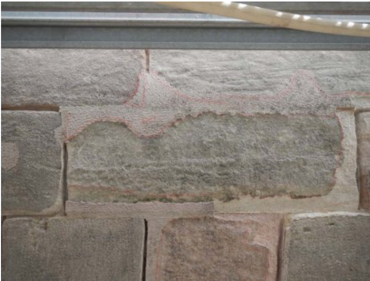
Detail von bereits ausgearbeiteten Fugen mit noch vorhandenen desolaten Altergänzungen.