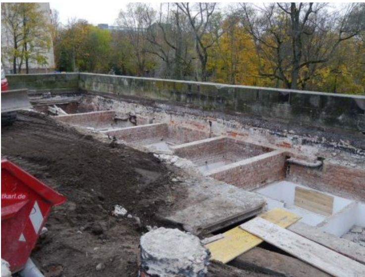
Aushub von Erdreich rückseitig der Mauerkrone.