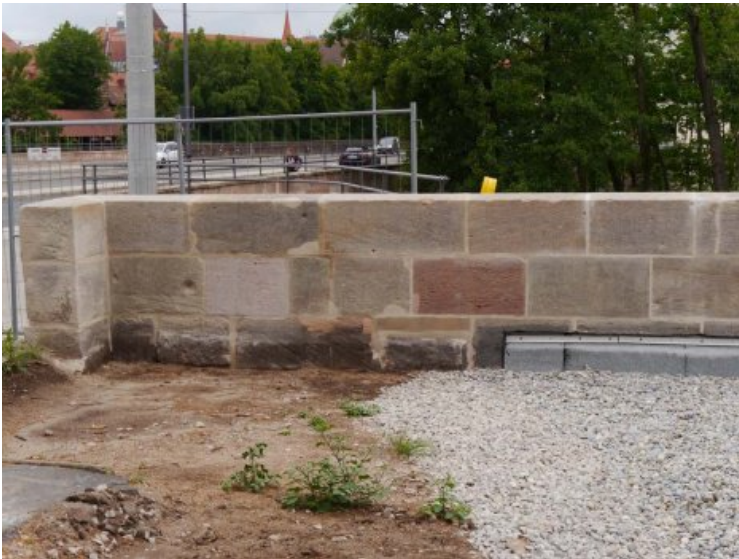
Rückseitige Mauerkrone nach der Restaurierung.