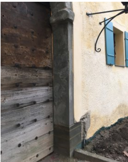
Die Fehlstelle wurde durch ein Neuteil geschlossen. In das Neuteil wurden Scheinfugen eingearbeitet.