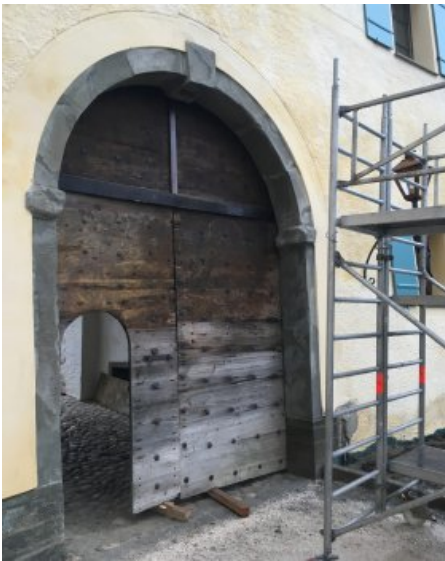
Die Portallaibung nach der Restaurierung.