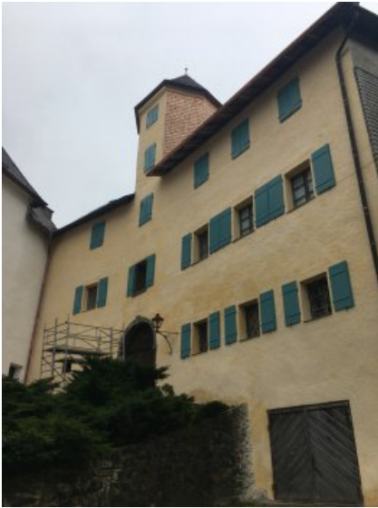
Gesamtansicht der Fassade mit bearbeitetem Portal und Fenstern nach der Restaurierung.