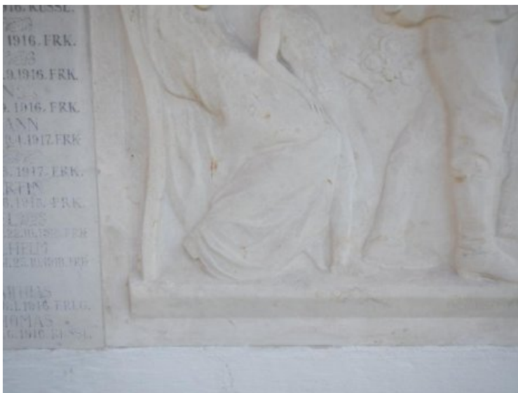
Endzustand: gereinigte, wiederhergestellte Formen