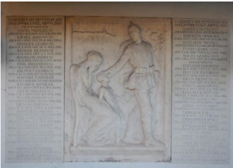
Vorzustand: starke Verschmutzung, geringe Lesbarkeit der Inschriften in den unteren Bereichen, Fehlstellen