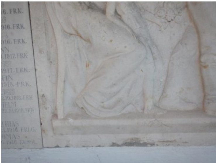
Vorzustand: kleinteilige Ausplatzungen, Mörtelkrusten