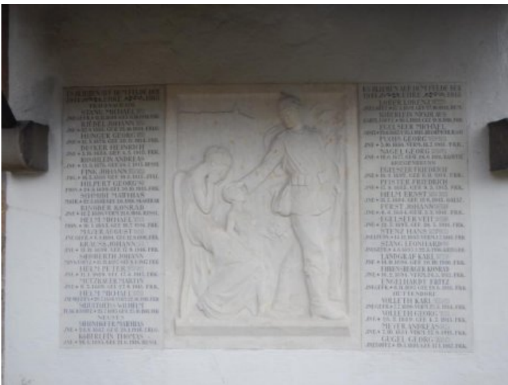
Endzustand: harmonischer Gesamteindruck und wiederhergestellte Lesbarkeit