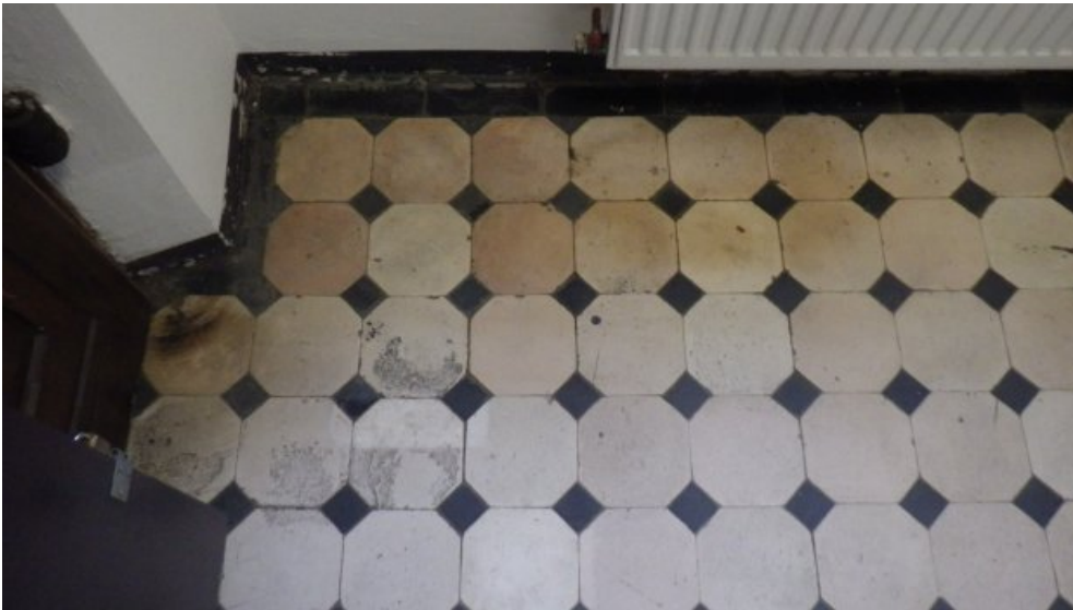
Die Fliesen waren verschmutzt und partiell geschädigt. Das Mörtelbett war defekt und Fliesen gelockert.