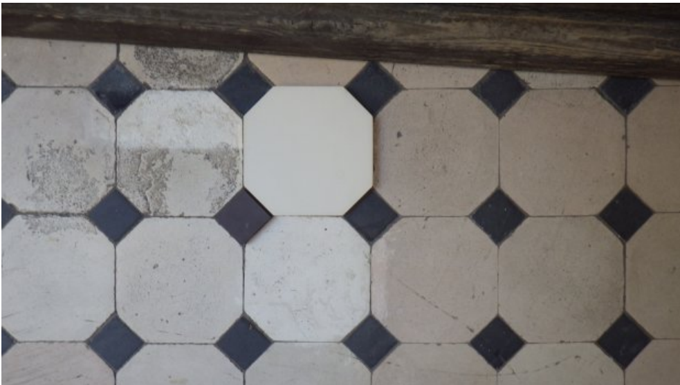
Nach der Reinigung wurden Probestfliesen bestellt und farblich passende Bodenfliesen ausgewählt.