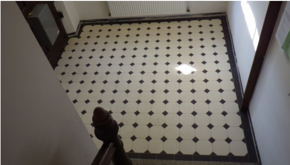
Neu verlegte Bodenfliesen im Eingangsbereich.