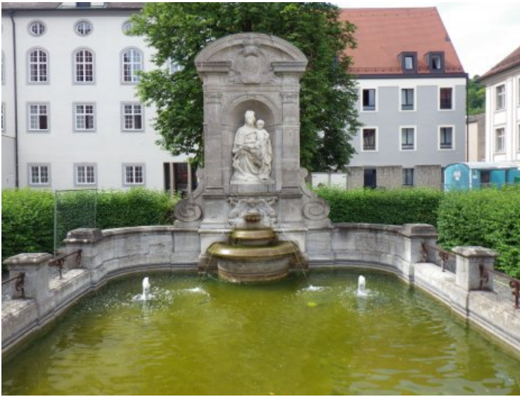
Vor Beginn der Maßnahme