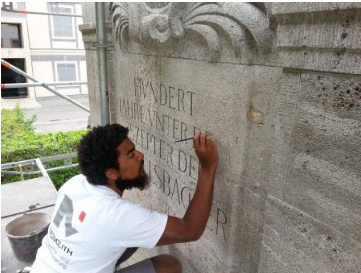
Zur Verbesserung der Lesbarkeit der Inschrift wurden Buchstaben ausgemalt