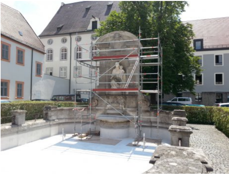
Die Brunnenanlage während der Restaurierung