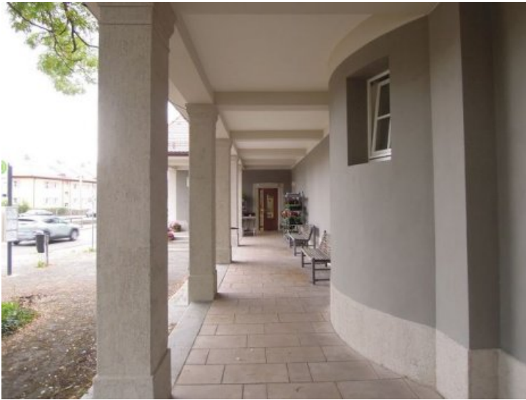
Innenansicht des restaurierten Laubengangs.