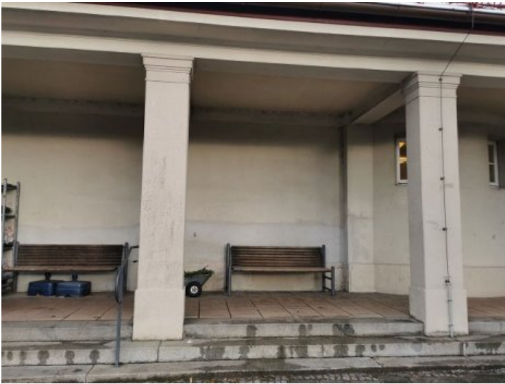
Blick von der Straßenseite aus auf den Laubengang zwischen Portal und Pavillion/Blumenladen im Vorzustand.