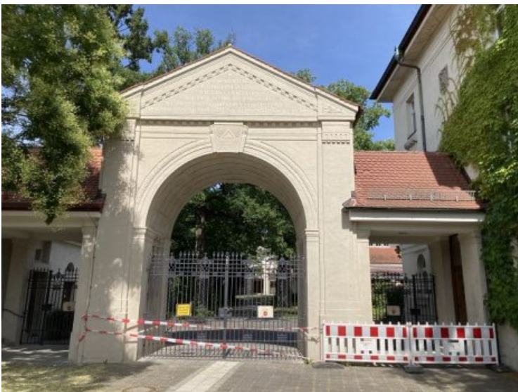
Ansicht von der Straßenseite aus auf das fertiggestellte Portal.