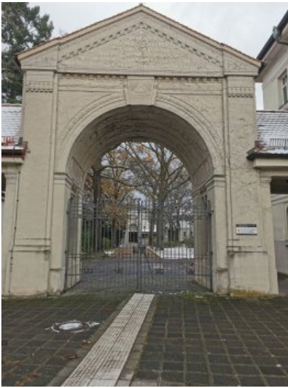
Vorderseite der Portalanlage vor Beginn der Maßnahmen mit deutlich verschmutzter Oberfläche.