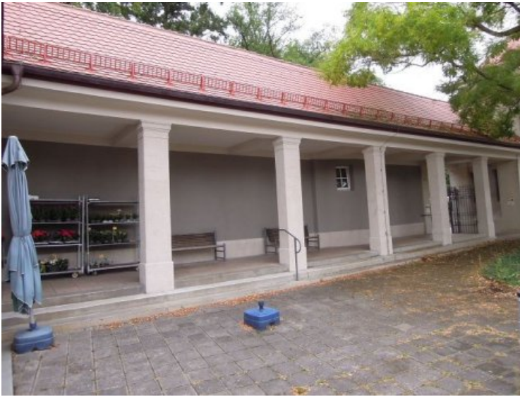
Aufnahme des Laubengangs nach dem Beenden aller Maßnahmen.