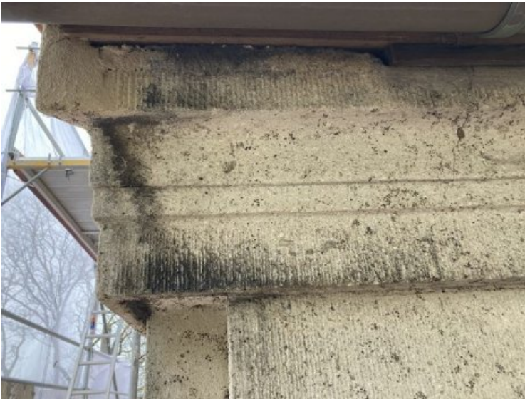
Dunkle Auflagerungen an der Oberfläche der Portalanlage im Detail.