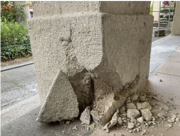
Stark beschädigter Bereich eines Pfeilers im Detail.