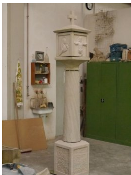
Der fertige Bildstock in der Firma.